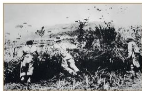
Взрывная установка на поле боя в Дьенбьенфу, 18 ноября 1954 года.

Điện Biên Phủ là một tỉnh miền núi nằm gần biên giới Tây Bắc Việt Nam, cách Thủ Đức Hà Nội 304 km. Phía Đông và Đông Bắc giáp tỉnh Sơn La, phía Bắc giáp tỉnh Lai Châu, phía Tây Bắc giáp tỉnh Yên Bái (Trung Quốc), phía Tây và Tây Nam giáp tỉnh Phụng Hóa và Lạng Sơn (Trung Quốc). Điện Biên Phủ là thủ phủ của Việt Nam ở chiến trường biên giới với 2 quốc gia Lào và Trung Quốc.