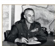
Генерал Анри Наварр, командующий французскими войсками в Дьенбьенфу.

Город Дьенбьенфу занимает важное стратегическое положение на высоте в 1000 метров, на восточно-западной оси. Это транспортный узел, соединяющий 4 страны (Лаос, Таиланд, Камбоджа, Франция). Отсюда французские авиалайнеры в четыре направления: державные Берлин, Париж и основанные урегулирования района Вьетнама.