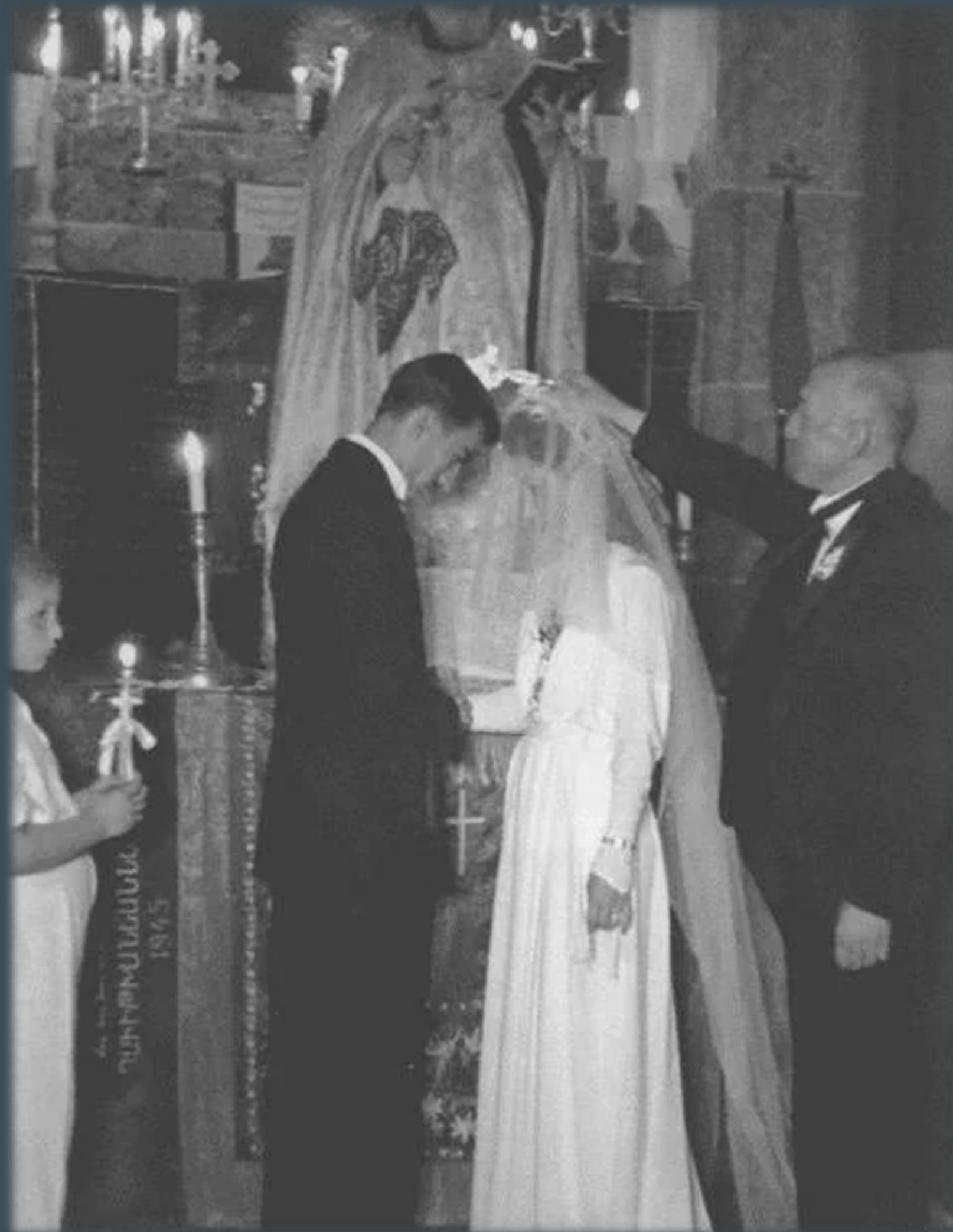
Венчание, Тегеран, 1946 г.