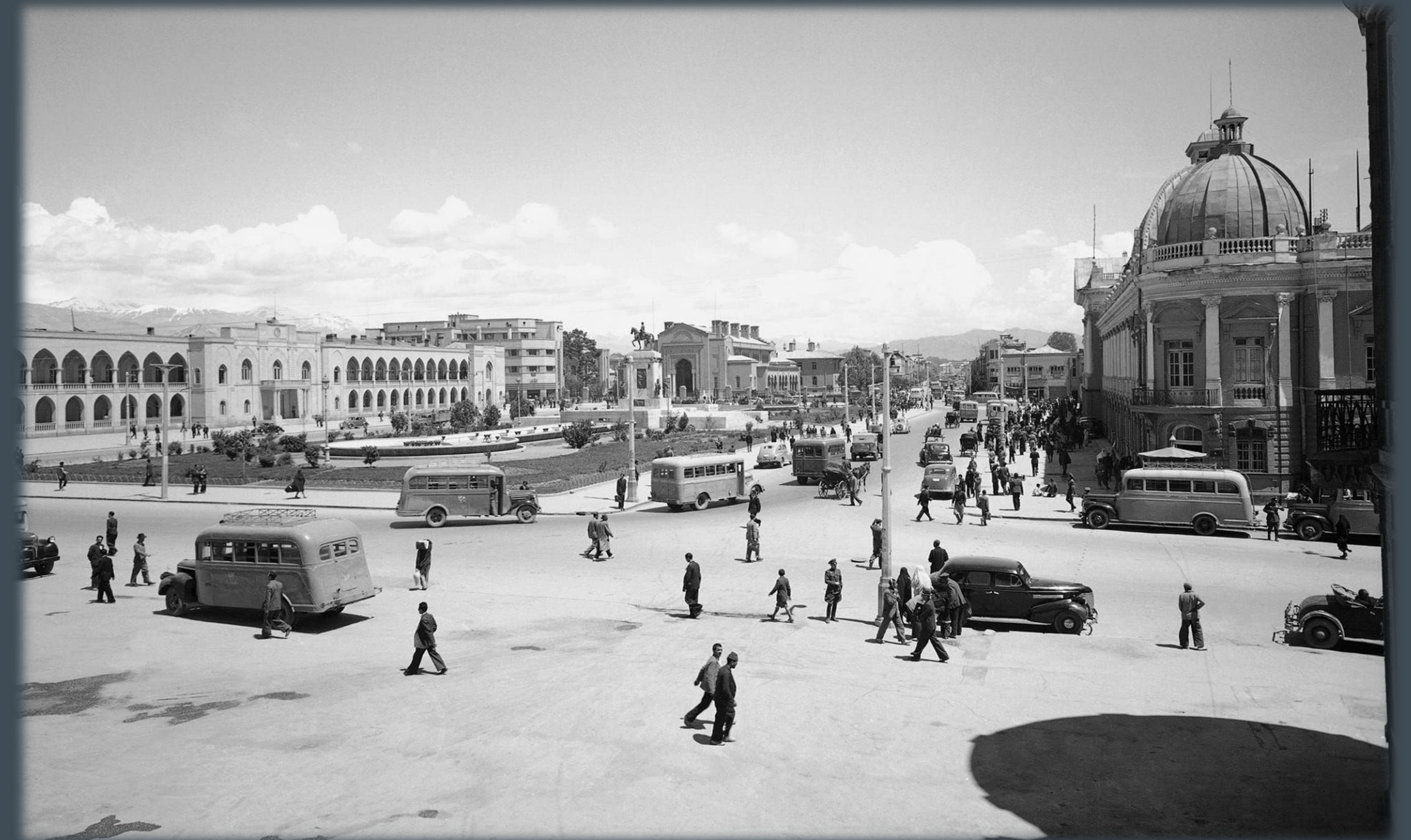
Тегеран, вид на главную площадь, 1946

В 1942 г. по заданию Агаянца Геворк внедрился в британскую разведшколу, которая работала по территории СССР. Это позволило перехватить большую часть забрасываемых агентов и закрыть школу. Кроме того, Геворк получил ценный опыт профессионального обучения.