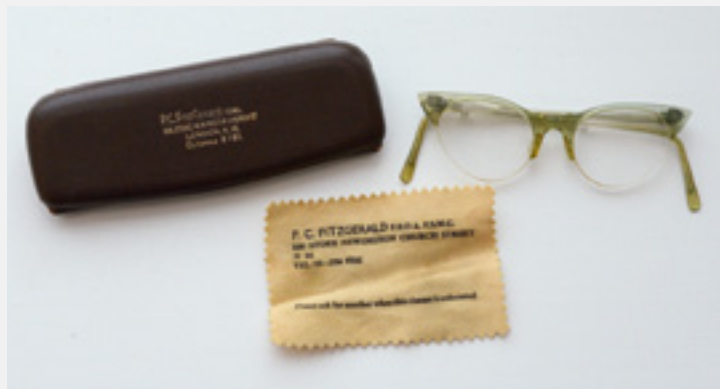
Личные вещи разведчиков Леонтины и Морриса Коэн