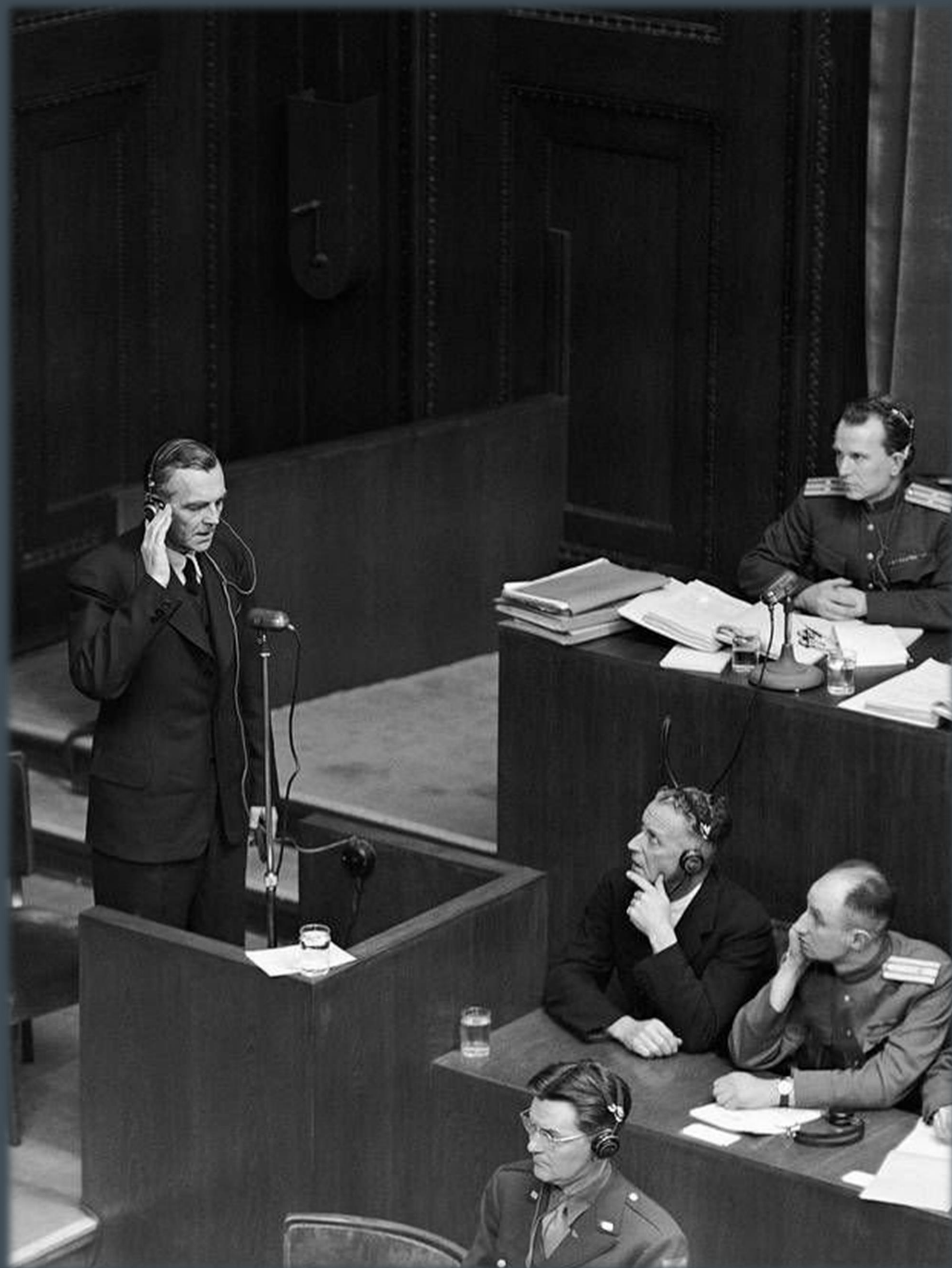
Ф. Паулюс дает показания на Нюрнбергском процессе