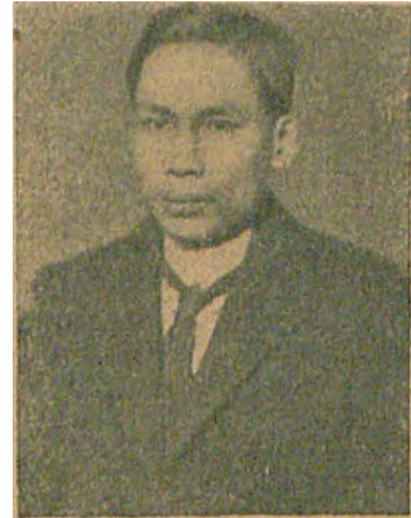
Фотография Нгуен Ай Куока в журнале «Огонек» № 39, 1923

Однако необходимость продолжать революционную деятельность в Индокитае не могла позволить Нгуен Ай Куоку надолго задержаться в Советском Союзе, и 11 ноября 1924 г. он отправляется в Кантон.