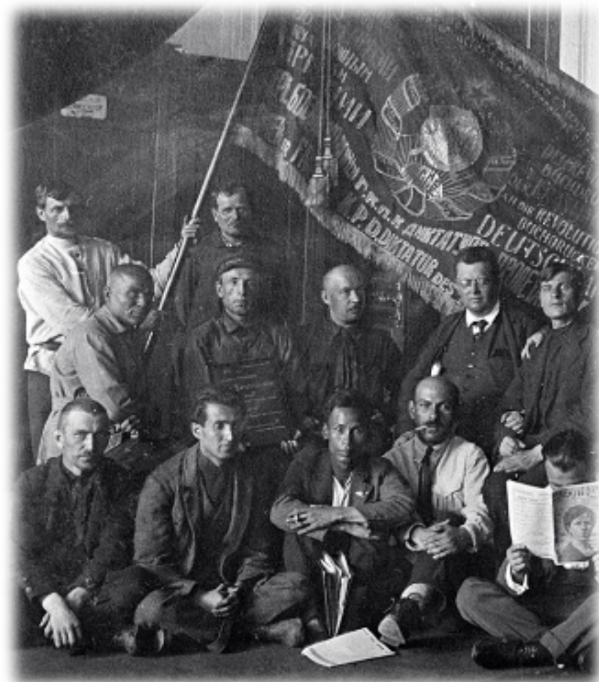
Нгуен Ай Куок – делегат V конгресса Коминтерна

Также, Нгуен Ай Куок добился того, что первая группа вьетнамцев выехала на обучение в Коммунистический университет трудящихся Востока в 1925 г.