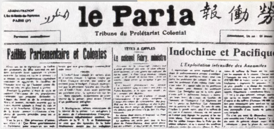
Слева – направо: «Суд над французским колониализмом», статья на смерть Ленина в газете «Правда», пример газеты «Le Paria»