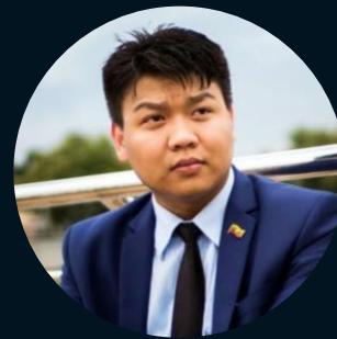
Должностное лицо Министерства обороны Мьянмы Кьяу Зин Линн