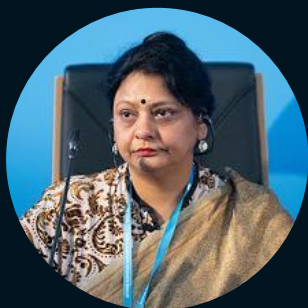
Президент Международного форума стран БРИКС Пурнима Ананд