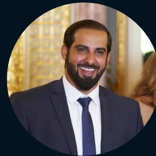
Советник президента ОАЭ Абдурахман Ибрахим Аль-Хаммади