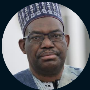
Чрезвычайный и Полномочный Посол Республики Нигерия Шеху Абдуллахи