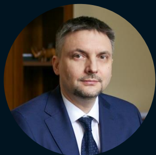
Вице-губернатор Санкт-Петербурга Казарин Станислав Валерьевич