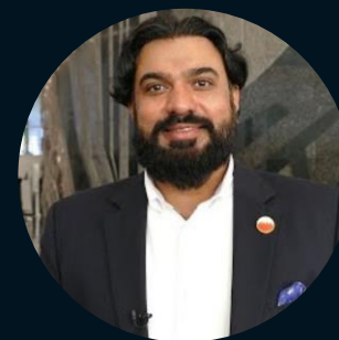
Предприниматель, инвестор из Египта Мохаммад Шахид Хан